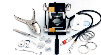
GS15800 高温定厚フィルム作製システム プレス機が別途必要です