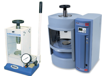
アトラス手動プレス (15/25 トン) アトラス自動プレス (8/15/25/40 トン)