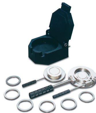
GS15640 定厚フィルム作製システム