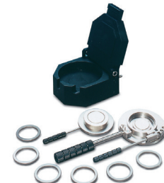
GS15640 定厚フィルム作製システム 加熱プラテン・プレス機が別途必要です