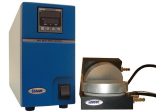
GS15515 アトラス加熱プラテン