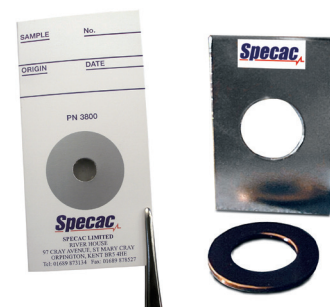
GS03800 スペカカード (開口部直径 10 mm、100 枚組)