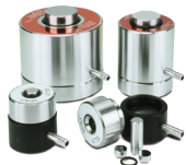
排気ポート付ペレットダイス 赤外測定用 KBr 錠剤、蛍光 X 線測定用ペレット等の作製に