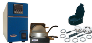
加熱プラテン (Max. 300°C) ・定厚フィルムメーカー プレスを加熱プレスとして使用できます